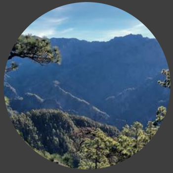
2 Mirador de Los Brecitos Los Brecitos viewpoint Aussichtspunkt Los Brecitos