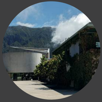
i Centro de visitantes Visitor center Besucherzentrum