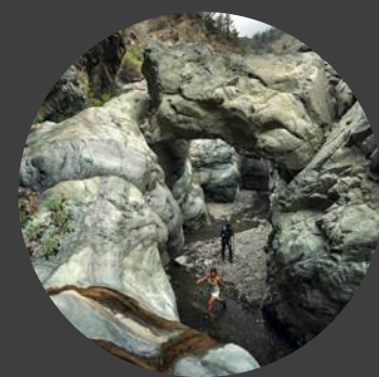
7 Barranco de las Angustias Barranco de las Angustias Barranco de las Angustias