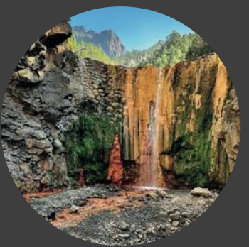
5 Cascada de Colores Waterfall Cascada de Colores Wasserfall Cascada de Colores