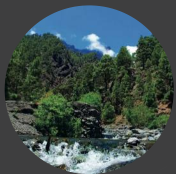
6 Dos Aguas Dos Aguas Dos Aguas