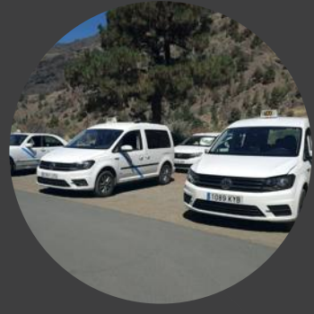
1 Estacionamiento & Taxis Parking & Taxis Parkplatz & Taxis