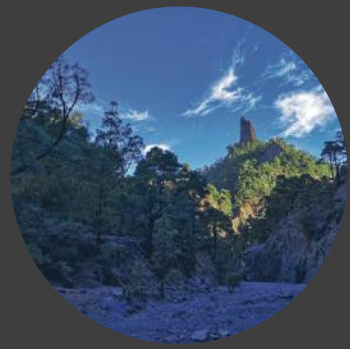
4 Roque Idafe Roque Idafe Roque Idafe