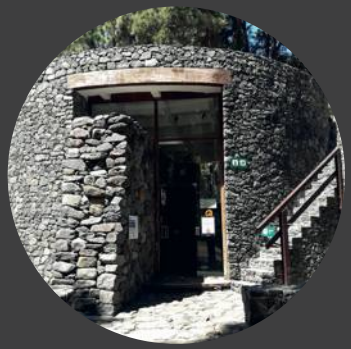
3 Centro de servicios Service Centre Service Zentrum